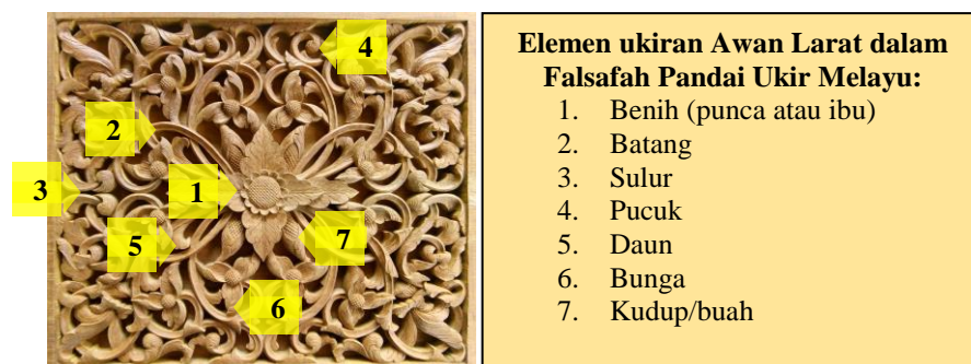
Gambarajah 04: Contoh elemen yang terdapat pada ukiran kayu Awan Larat Melayu Sumber dari En. Zarir Hj. Abdullah (2019), pandai ukir Melayu Kg. Raja, Besut, Terengganu.

53 Gambarajah 04 adalah analisa dari pandai ukir Melayu iaitu En. Zarir Hj. Abdullah. Berdasarkan perkongsian daripada beliau, penyelidik berpendapat bahawa falsafah dan elemen ukiran motif biasanya diajar oleh adiguru pandai ukir sebelumnya agar dapat menilai dan menginterpretasi makna sesebuah reka corak ukiran kayu dengan lebih efisien dan praktikal terutama ketika menghasilkan karya ukiran sendiri.